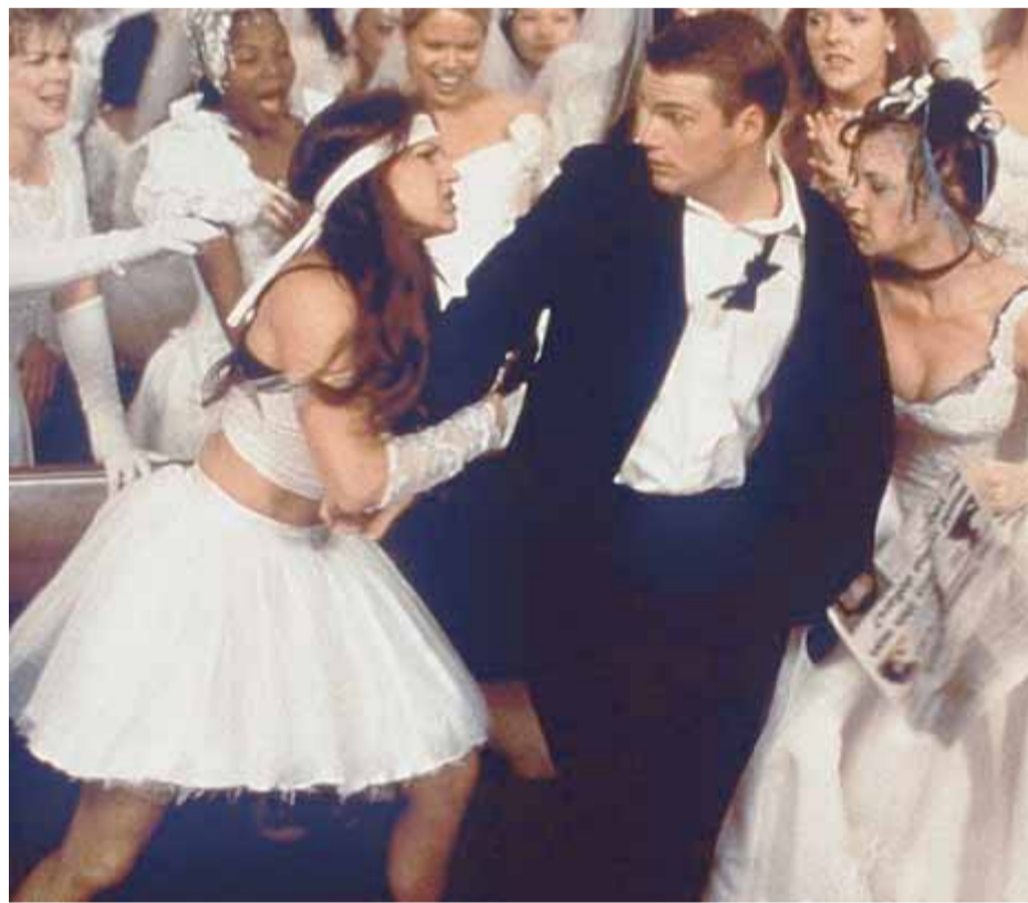
No sempre es té tanta requesta com Chris O'Donnell a la pel·lícula 'The Bachelor'.

ESTUDIES O TREBALLE? Hi ha una mica més de dos milions de solters (2.009.000 segons l'Idescat i 2,5 milions de persones sense parella si s'hi sumen els separats i vidus) a Catalunya i